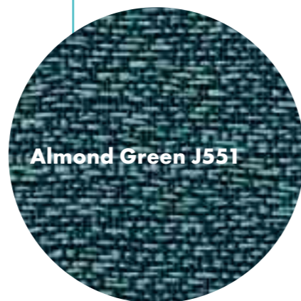
Almond Green J551