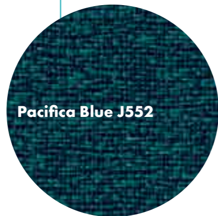
Pacifica Blue J552