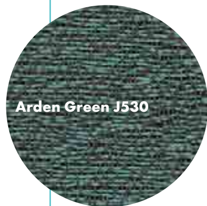
Arden Green J530