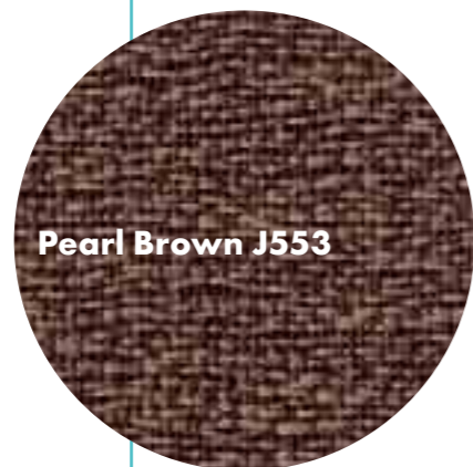
Pearl Brown J553