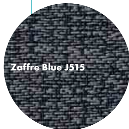
Zaffre Blue J515