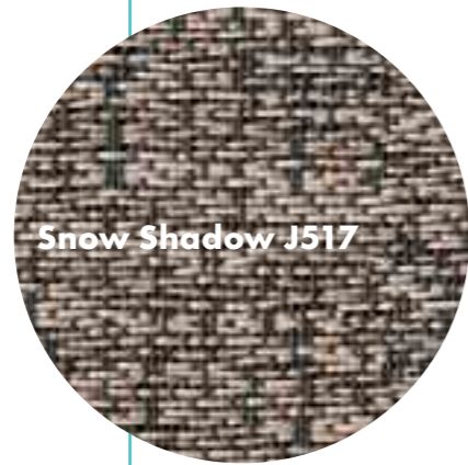
Snow Shadow J517