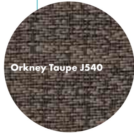
Orkney Taupe J540