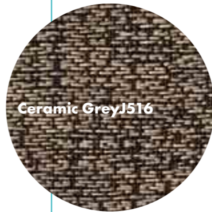
Ceramic Grey J516