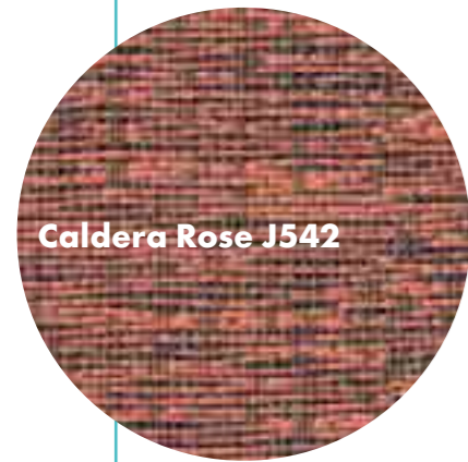
Caldera Rose J542