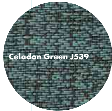
Celadon Green J539