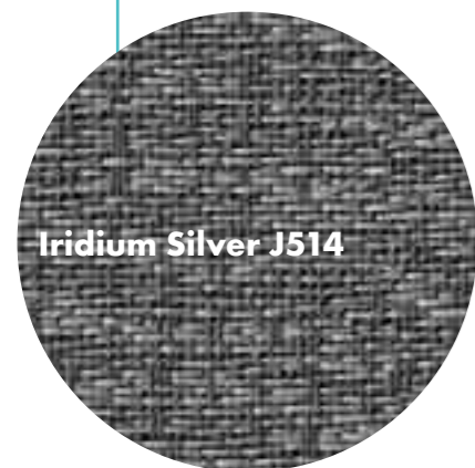
Iridium Silver J514