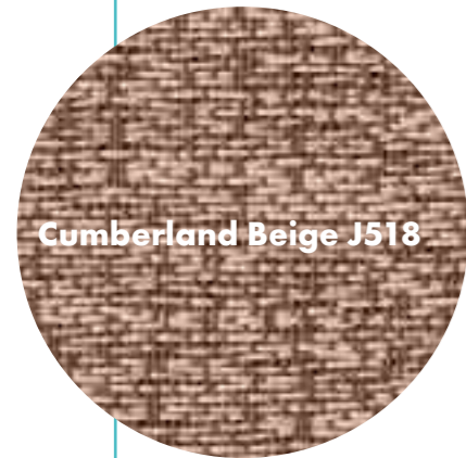
Cumberland Beige J518