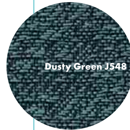
Dusty Green J548