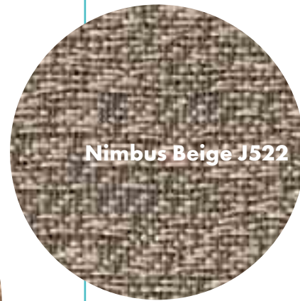
Nimbus Beige J522