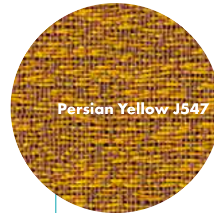
Persian Yellow J547