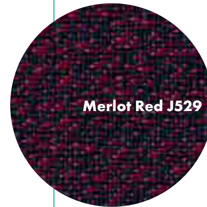
Merlot Red J529