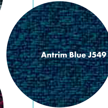
Antrim Blue J549