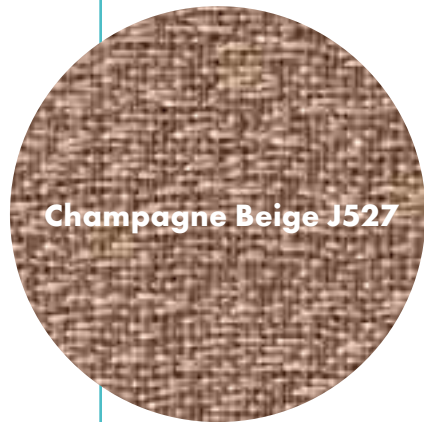
Champagne Beige J527