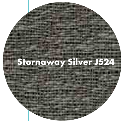
Stornaway Silver J524