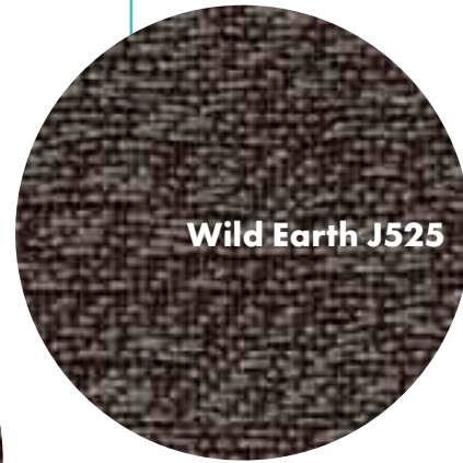
Wild Earth J525