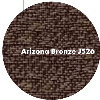
Arizona Bronze J526