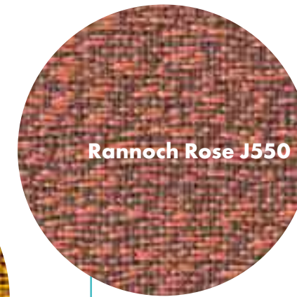
Rannoch Rose J550