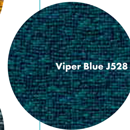
Viper Blue J528