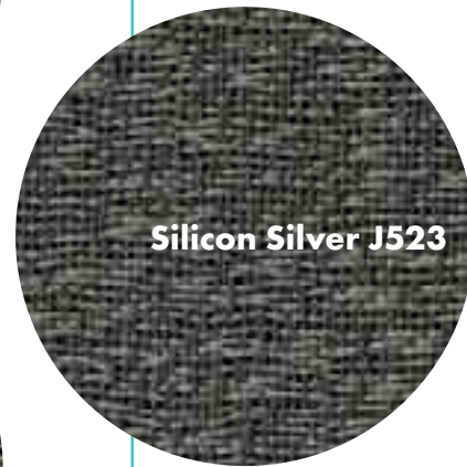
Silicon Silver J523